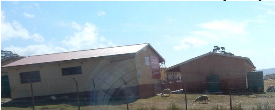
De (opgeknapte) school in Qunu, waar Nelson Mandela naar school ging.

Dit 'land' bestond uit een grote en twee kleine enclaves tussen de Kei-rivier en Lesotho. Ook deze naam heeft de maken met de ligging: over de Kei-rivier. Het was het traditionele vaderland van de Xhosa. De hoofdstad was Umtata, de geboortegrond van Nelson Mandela.